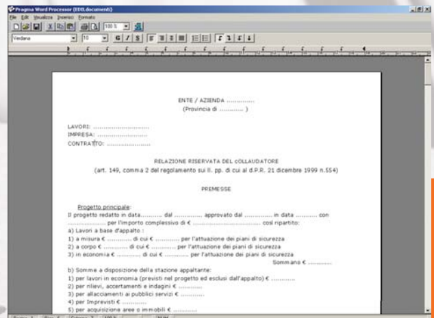
funzione di anteprima di stampa